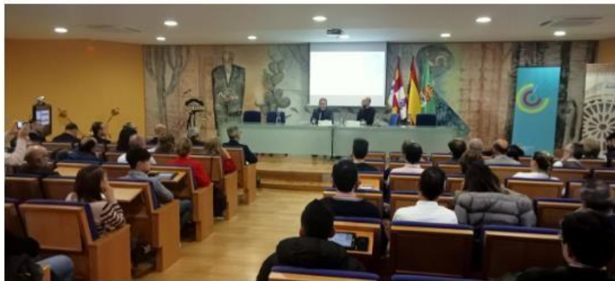
Un momento de la jornada organizada por el Consejo Social de la Universidad de León. A. C.

La Universidad acoge una jornada 'Explorando la Inteligencia Artificial. El futuro ya está aquí' para analizar el impacto de esta herramienta