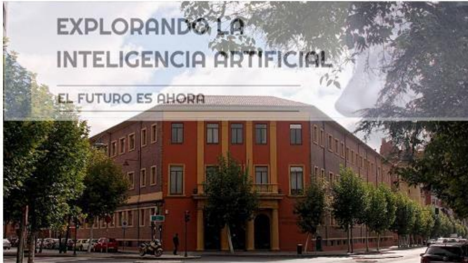
ULE, Proconsi y FELE organizan una jornada con la IA como foco

El uso de la Inteligencia Artificial en el mundo empresarial será el foco sobre el que la Universidad de León, en colaboración con Proconsi y FELE trabajarán en la jornada 'Explorando la Inteligencia Artificial' que tendrá lugar en el rectorado de la ULE el próximo 29 de noviembre.