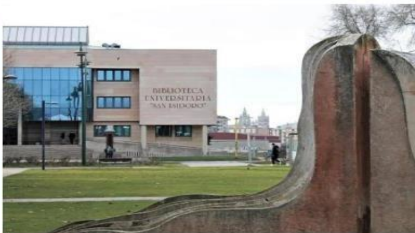
Campus de Vegueros de la Universidad de León.

El Consejo Social de la Universidad de León celebra la jornada 'Explorando la inteligencia artificial. El futuro es ahora' para que la sociedad «se inicie» en la materia ante «la incultura existente al respecto»